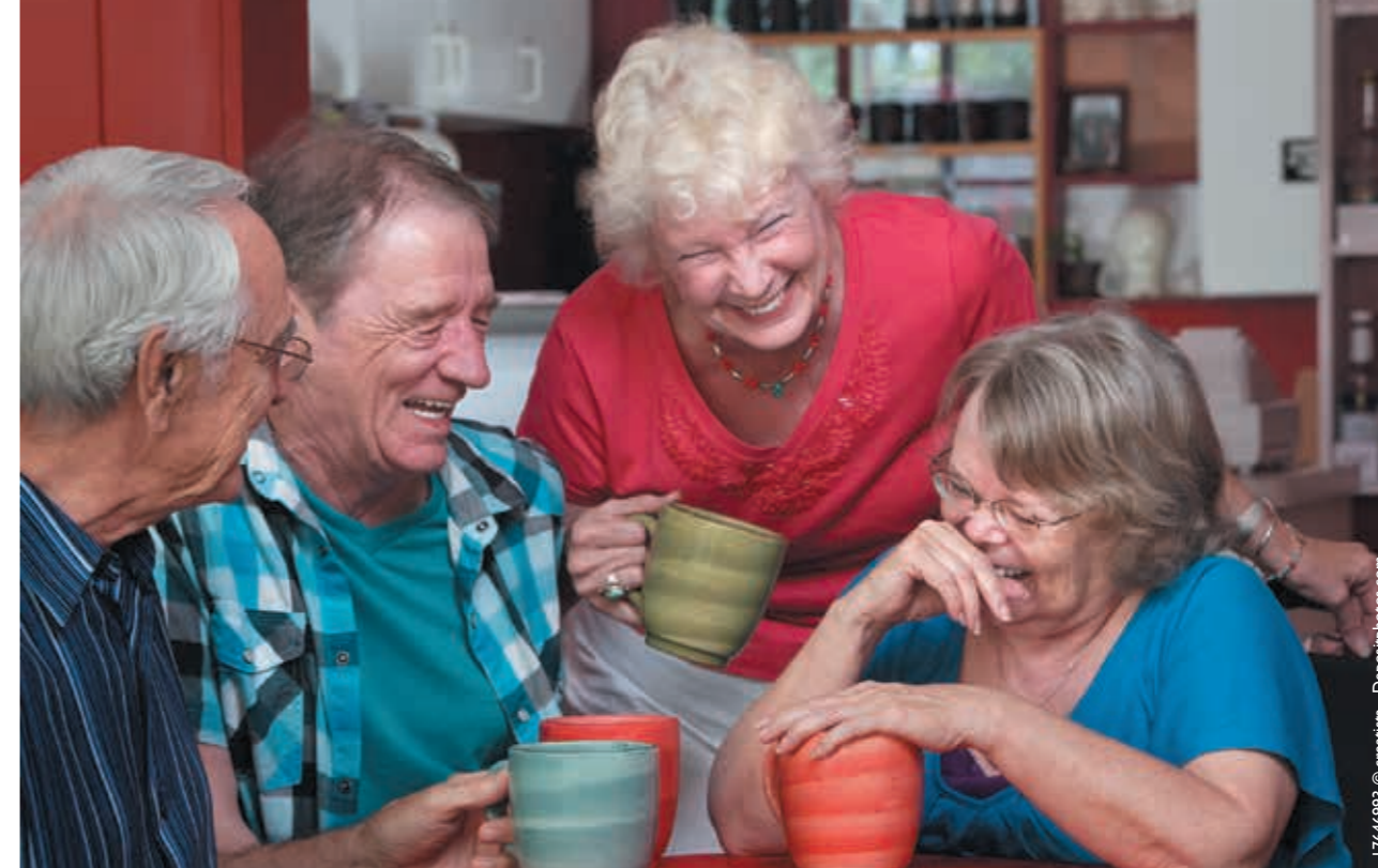
17646993 © creatista - Depositphotos.com