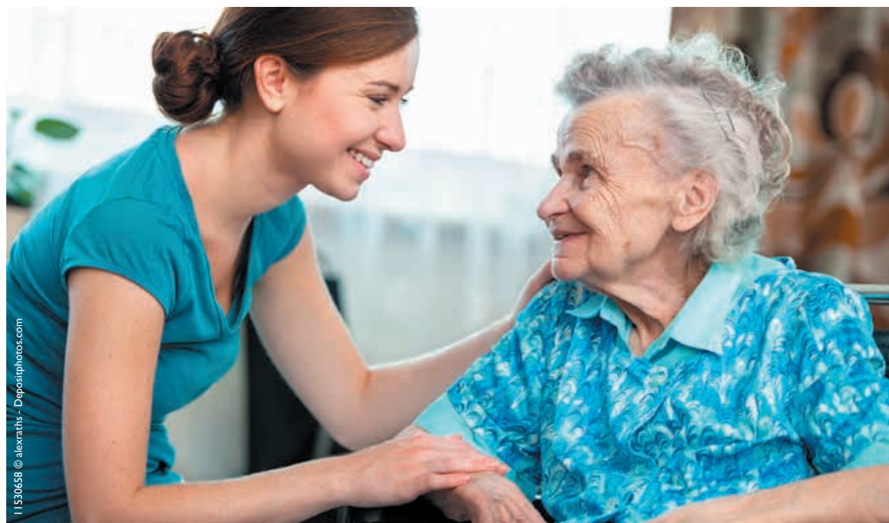
11530658 © alexarths - Depositphotos.com

Elles surveillent avec bienveillance l'état de santé des résidents afin d'alerter très rapidement, en cas de dégradation.