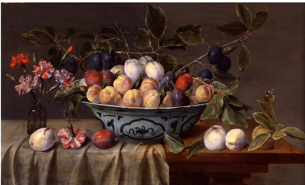
Jacob van Hulsdonck (1582-1647), Nature morte à la céramique Wan Li et au bouquet d'œillet , Huile sur panneau, Musée d'Art et d'Histoire de Melun