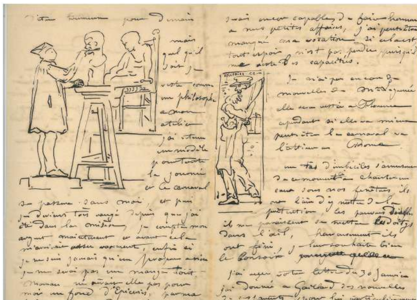
« Atelier du sculpteur à Rome », dessin à l'encre, Lettre d'Henri Chapu à ses parents, Rome, 9 Février 1858, L.A.S Chapu-1858-1-6