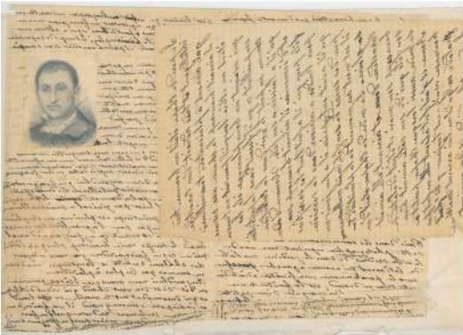
« Portrait du jeune sculpteur à 23 ans », dessin au graphite, Lettre d'Henri Chapu à ses parents, Rome, 17 mai 1856, L.A.S Chapu-1856-1-20