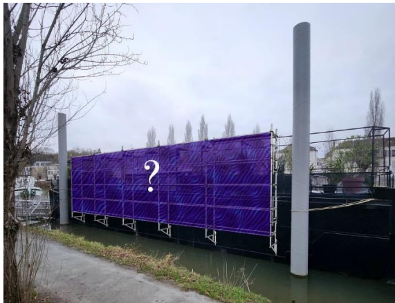
Péniche Guinguette Geek – Modèle Implantation 3