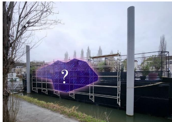
Péniche Guinguette Geek – Modèle Implantation 2