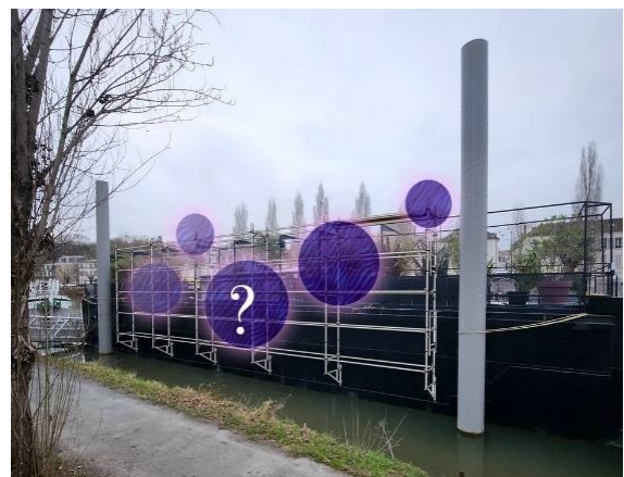
Péniche Guinguette Geek – Modèle implantation 4