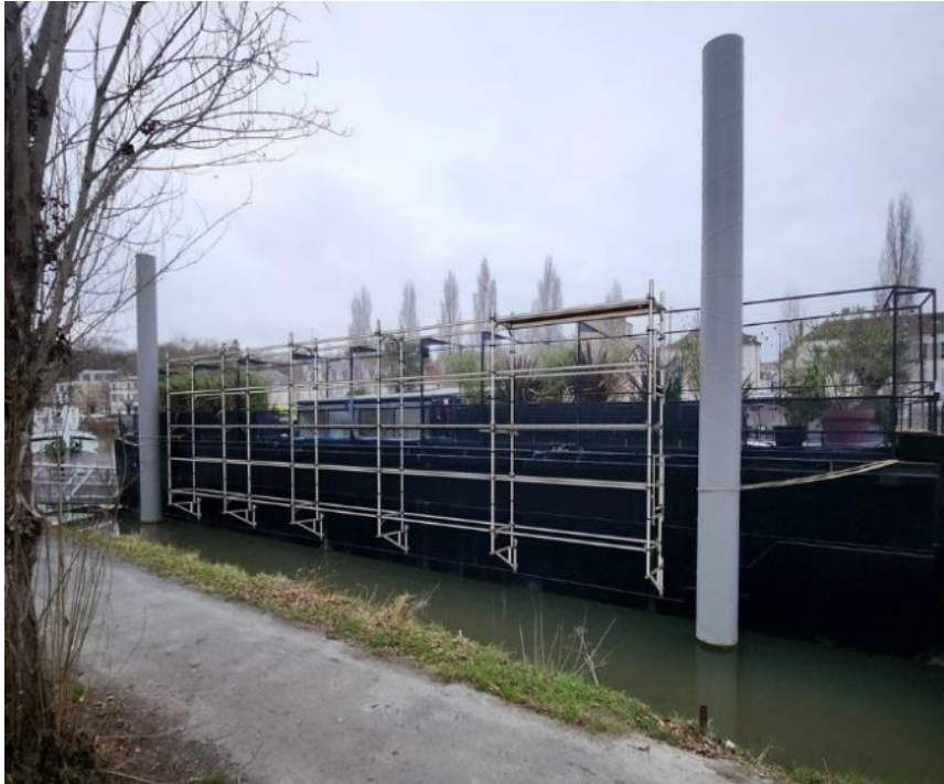
Péniche Guinguette Geek – Échafaudage Nu