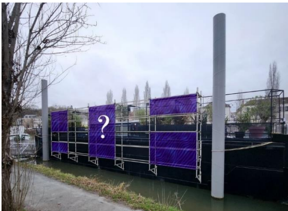
Péniche Guinguette Geek – Modèle Implantation 1